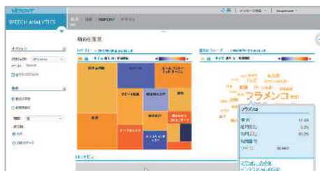
週間から年間まで、様々な期間範囲で急増減した語句を自動的に発見し、顧客の傾向を把握

Verint SAは、期間内に最も出現頻度が増減した語句を全通話から自動的に発見します。トレンド分析では、語句指定が一切不要であり、予想外の急増減語句の発生を把握でき、また、予めキーワードを設定しておいて、それを含む通話の増減を把握することもできます。この傾向の発見と証明により、問題に対して先見性をもった対策を実施することが可能になります。