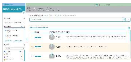
相関性の高い語句により通話群を同一内容に自動的にグループ化

膨大な応対音声は任意の課題カテゴリーに自動分類されます。カテゴリーには特定の言葉、感情通話、CTIタグなどの分類条件を設定することができます。分類された通話は、根本原因の分析機能によって相関性の高い語句で同一内容の通話群にまでグループ化され、顧客の架電理由を即座に把握することが可能になります。