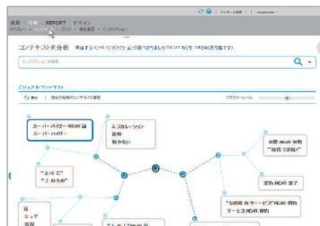
任意の語句と相関性の高い語句をクラスターごとにまとめ、コンテキストを視覚化表示

任意の検索語句が全通話中にどれだけ出現しているか、その検索語句と相関性が高い語句は何か、をガイドつき検索のオート・コンプリート機能で提示させることができます。また、視覚化機能で語句が顧客対応のどのような文脈で使用されているかを把握し、効率的な検索と文脈分析を行うことが可能です。